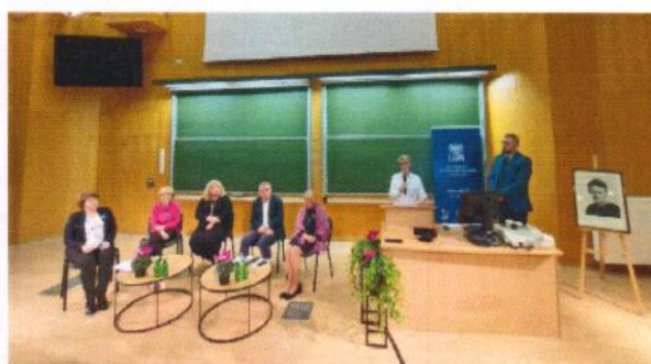
VI Laboratorium Kobiet na Wydziale Fizyki UAM ZOSTANE NOBLISTKA

00-227 Warszawa, ul. Freta 16, tel. 22 831 13 04